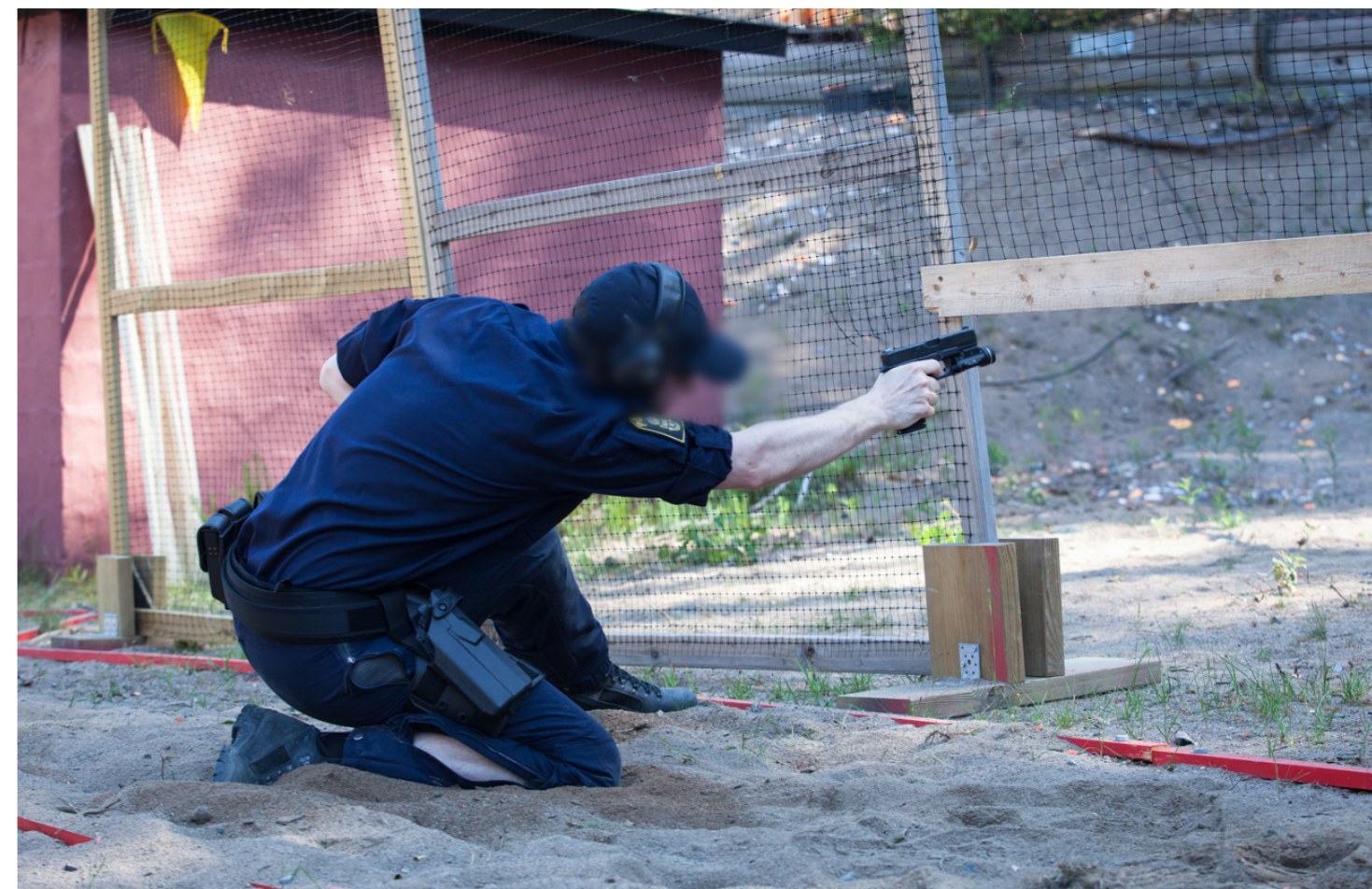
De 6 tavlorna vid station 4 sköts från olika positioner och skytten fick bara skjuta med stark hand.

Målen kan variera mellan papptavlor med olika poängzoner, metallmål (plates eller poppers), målen kan vara fasta eller rörliga och naturligtvis variera i avstånd.