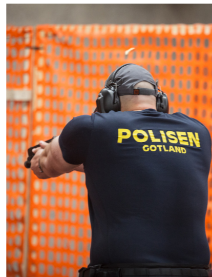
Många poliser börjar med dynamiskt skytte för att bli bättre och tryggare med sin vapenhantering i tjänsten.

Förberedelserna inför tävlingen började månader i förväg med noggrann planering och koordinering i samarbete med arrangerande förening Varpsund Arena Dynamiska skyttar och Varpsund Arena. Tävlingen och dess stationer ska även granskas och sanktioneras av Svenska dynamiska sportskytteförbundet.