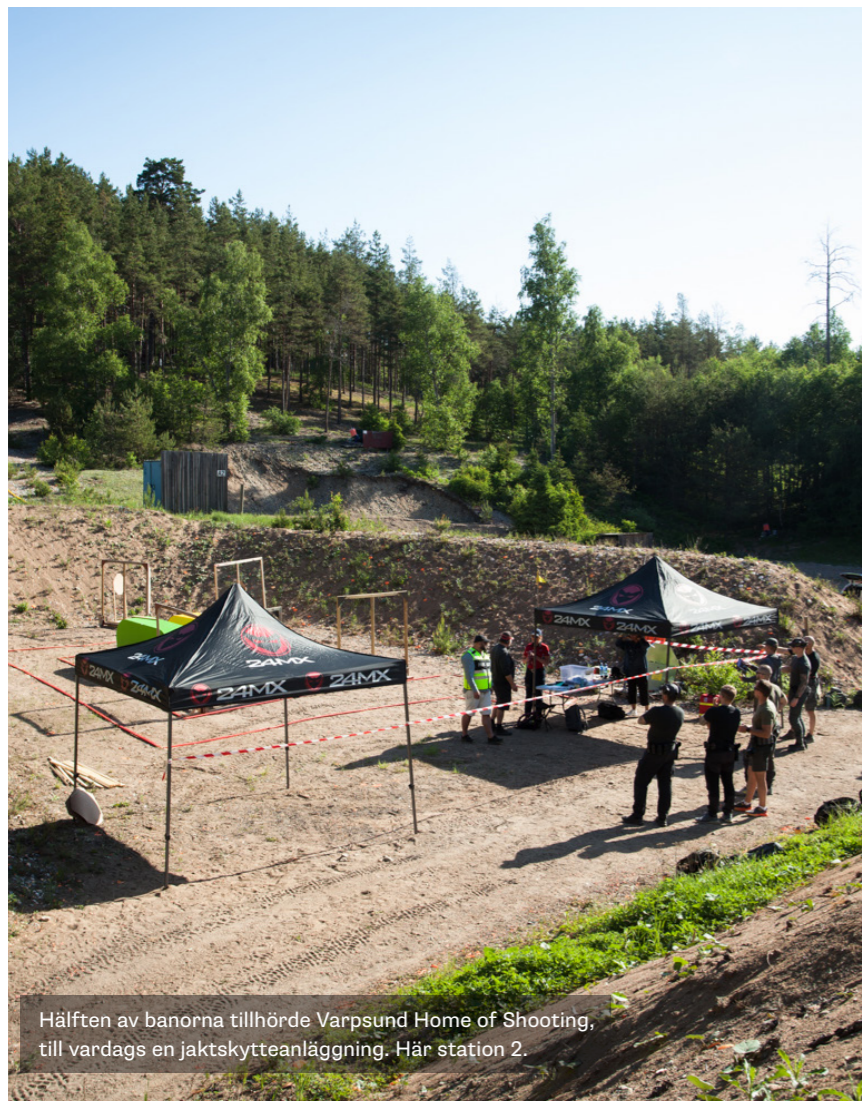
Hälften av banorna tillhörde Varpsund Home of Shooting, till vardags en jaktskytteanläggning. Här station 2.