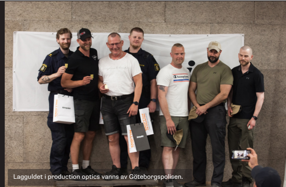
Lagguldet i production optics vanns av Göteborgspolisen.