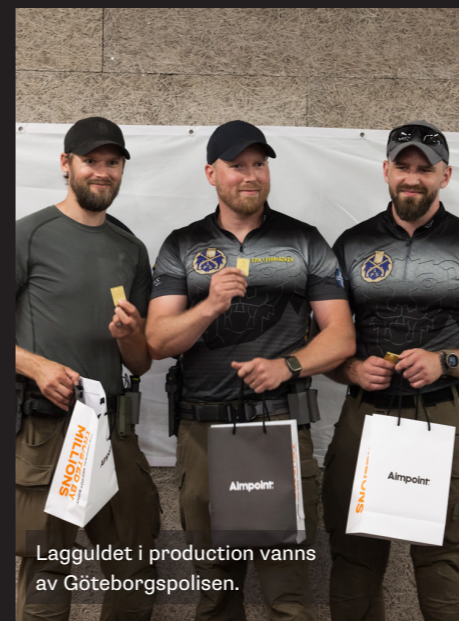
Lagguldet i production vanns av Göteborgspolisen.